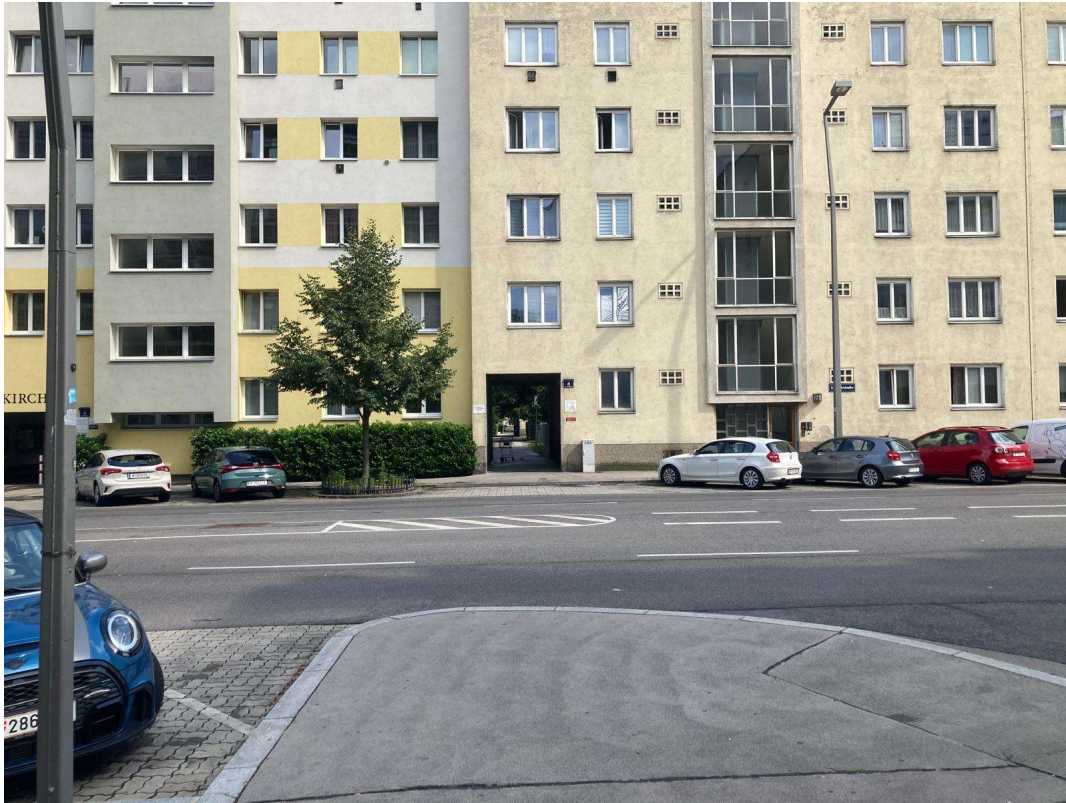
Abbildung 2 Foto - Weg über Machstraße zu Unterführung zu Kindergarten

ALT-Text: Der Kartenausschnitt markiert den oben beschriebenen Standort für den Zebrastreifen mit einer roten Strichlinie und einem roten Kreis.