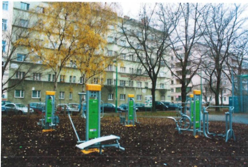
Free Gym im 20. Bezirk.

Niederschwellige Angebote für Bewegung und Sport sind uns ein wichtiges Anliegen. Durch die Errichtung von free Gym Anlagen wird der öffentliche Raum ganzjährig bei Schönwetter zum Fitness-Center. Derartige Anlagen gibt es bereits in 12 Bezirken in Wien.