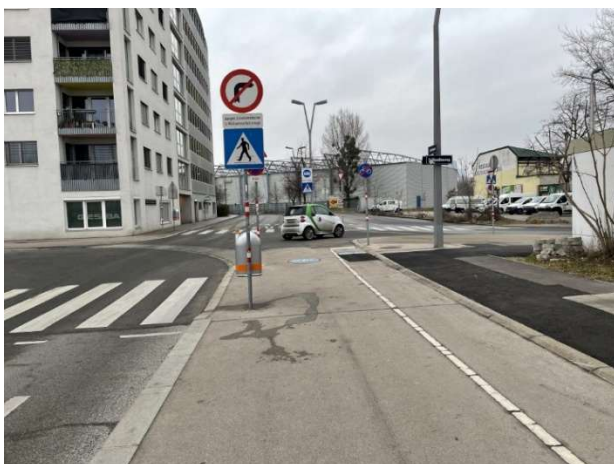
Alt-Text: Straßenszene mit Zebrastreifen, mehreren Verkehrsschildern u.a. Abbiegeverbot

Anrainer:innen haben darauf hingewiesen, dass das Abbiegeverbot laufend umgangen wird. Daher soll geklärt werden, ob das Abbiegeverbot an der Stelle aufgrund des geringen Verkehrsaufkommens weiterhin notwendig ist. Falls die Notwendigkeit festgestellt wird, sollte es auch exekutiert werden.