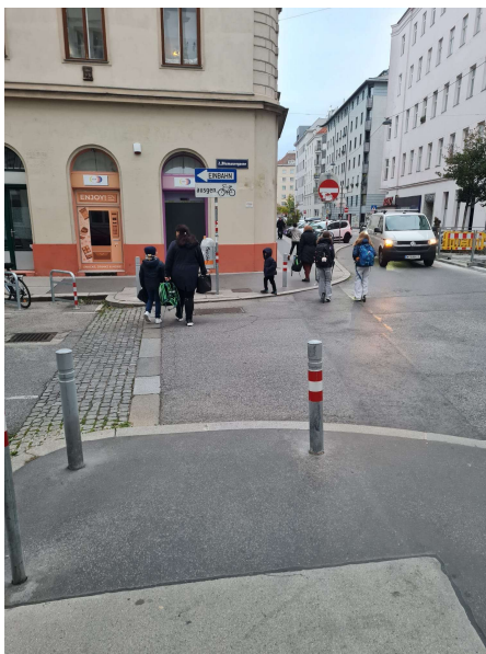
Abbildung 1 Foto - Überquerung Blumauergasse / Zirkusgasse

Am Ende der Blumauergasse wird auf Grund der Einbahnregelung zweiseitig der PKW-Verkehr aus der Zirkusgasse kommend eingeleitet. An dieser Stelle kommt es häufig zu Straßenüberquerungen, da sich hier ein Hauptweg zu nahegelegenen Schulen u. a. der GT Volksschule Novaragasse befindet. Die Anbringung eines Zebrastreifens würde maßgeblich zur Verkehrssicherheit der Volksschulkinder beitragen.